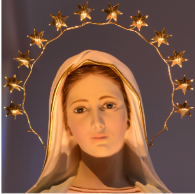
Nuestra Señora de Tihaljina

Únase a nosotros en un viaje de fe al pequeño pueblo de Medjugorje, Bosnia y Herzegovina. Millones de peregrinos han visitado Medjugorje, experimentando el amor de Dios que se difunde desde este santuario.