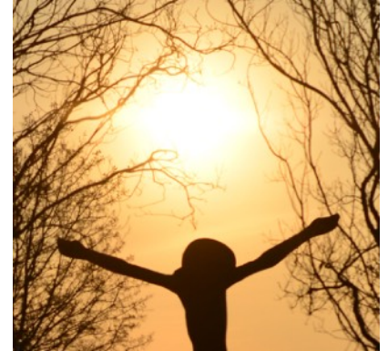
Estatua de Cristo

En 1981, seis niños afirmaron haber visto a la Santísima Virgen María. Estas supuestas apariciones continúan hoy, algunas a diario. El Vaticano continúa estudiando estos eventos en curso para determinar su autenticidad. Sin embargo, en mayo de 2019, el Papa Francisco autorizó a las parroquias a organizar peregrinaciones oficiales a Medjugorje en reconocimiento a los “abundantes frutos de gracia que han brotado de ella”.