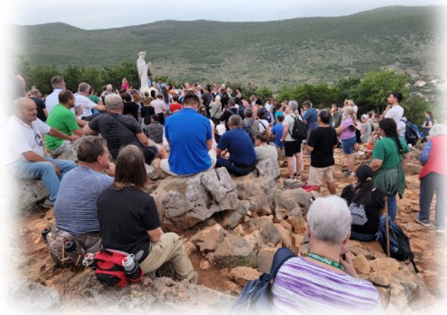
Colina de las apariciones.